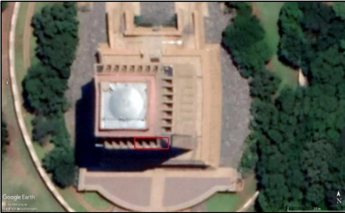
Rooi blokkie dui ondersoekarea aan.