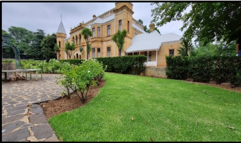
Onderhoud van Presidensie se tuin, Bloemfontein