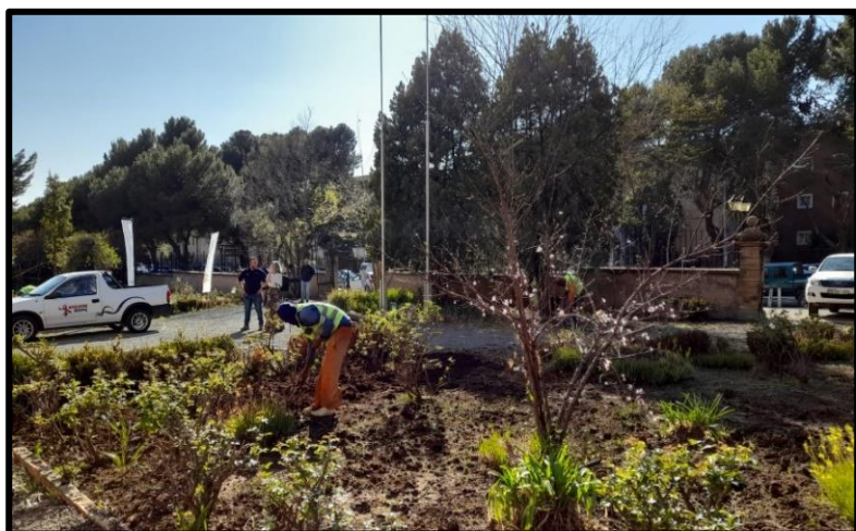
Onderhoud van Presidensie se tuin, Bloemfontein