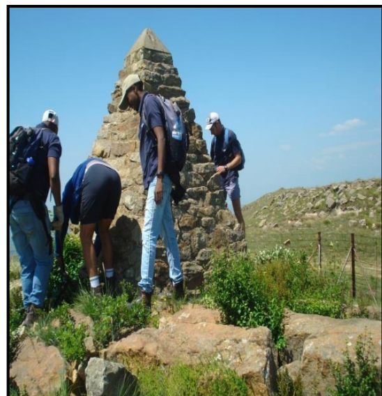
Vrywilligers help met die skoonmaak van die Kaalvoetvrou-terrein