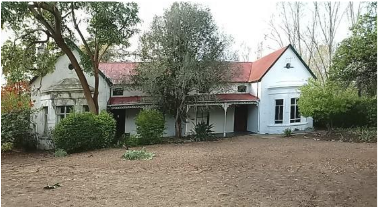
Koshuis en meesterskwartiere van die Paarl Public School for Boys (ES)

Die Erfenis Stigting het voorts die volgende inligting verskaf insake hulle samewerking met die Eugène Marais Stigting. Dit het betrekking op die ou skoolwerf van die Paarl Public School for Boys wat op een van die min onversteurde oop erf in die middel van die ou Paarl geleë is. Die werf is aangrensend tot die Zomerlust Gastehuis, eertydse herehuis van die De Villiers-familie wat die plaas Zomerlust in die 19de eeu tot en met die vroeë 1990's besit het. Volgens die ES is hulle deur die Eugène Marais Stigting (EMS) genader om 'n argeologiese verkenningsopname van die ou skoolwerf te maak, om te bepaal of dié stukkie grond 'n bydrae kan lewer tot die ryke geskiedenis van 19de-eeuse Paarl d.m.v. historiese argeologiese ondersoeke. Die verbintenis van die skoolwerf met Eugène Marais mag moontlik ook verder uitgebrei word, veral as die argeologiese opname sensitief gedoen word binne die doelstellings van die EMS, en dié instelling se meer as 40 geïdentifiseerde temas. Besoek www.eugene-marais.org.za vir meer inligting oor die Eugène Marais Stigting.